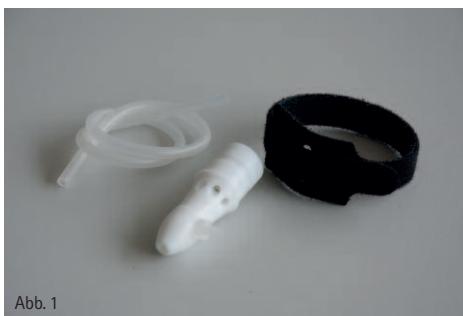
Abb. 1 bis 4: Düsenansätze für verschiedene Anwendungsfälle (1, 2) Nadeldüse für die Innenbehandlung von Sacklöchern und Kavitäten und die Nutzung von Sondergasen. Düsenansatz für die flächige Behandlung von sensiblen oder leitfähigen Oberflächen (3,4).

Zwei Typen von atmosphärischen Plasmasystemen dominieren die medizinischen und medizintechnischen Anwendungen: Dielektrische Barriereentladungen (dielectric barrier discharge,