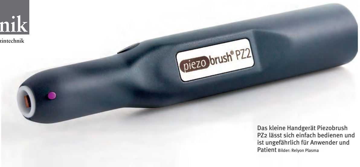
Das kleine Handgerät Piezobrush PZ2 lässt sich einfach bedienen und ist ungefährlich für Anwender und Patient

PEEK-Implantate: Plasma-Funktionalisierung reduziert Keime und verbessert Heilungsprozess